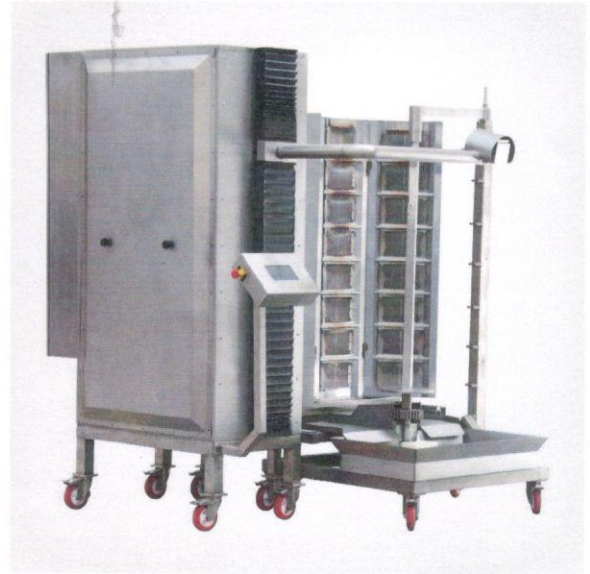
1.2 Döner Pişirme Robotu