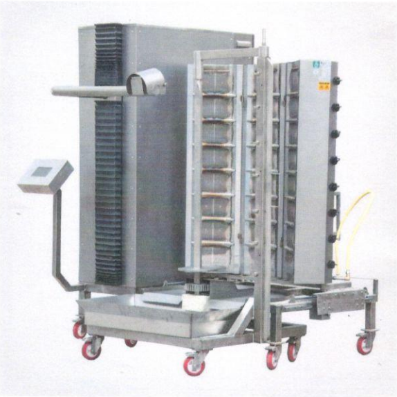
1.3 Döner Pişirme Robotu