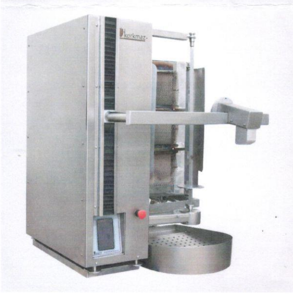
1.3 Otomatik Döner Pişirme, Kesme, Dilimleme Ve Tartma Makinası