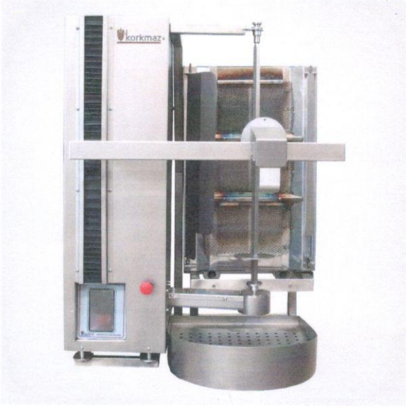
1.1 Otomatik Döner Pişirme, Kesme, Dilimleme Ve Tartma Makinası