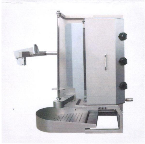
1.4 Otomatik Döner Pişirme, Kesme, Dilimleme Ve Tartma Makinası